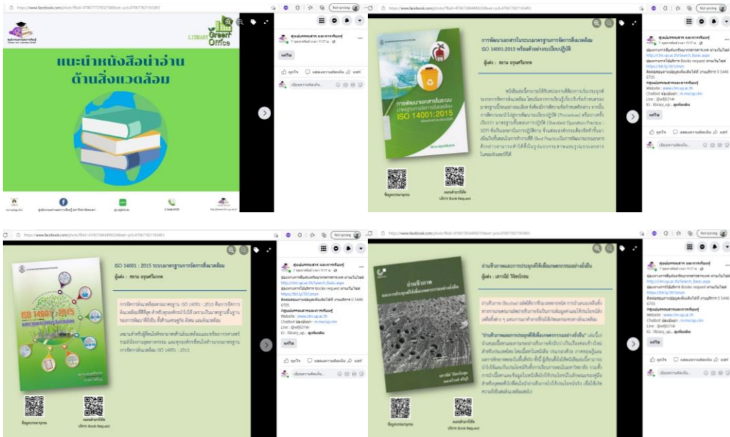
ภาพที่ 5 การแนะนำหนังสืออ่าน ด้านสิ่งแวดล้อม ผ่าน Facebook และ Fan page