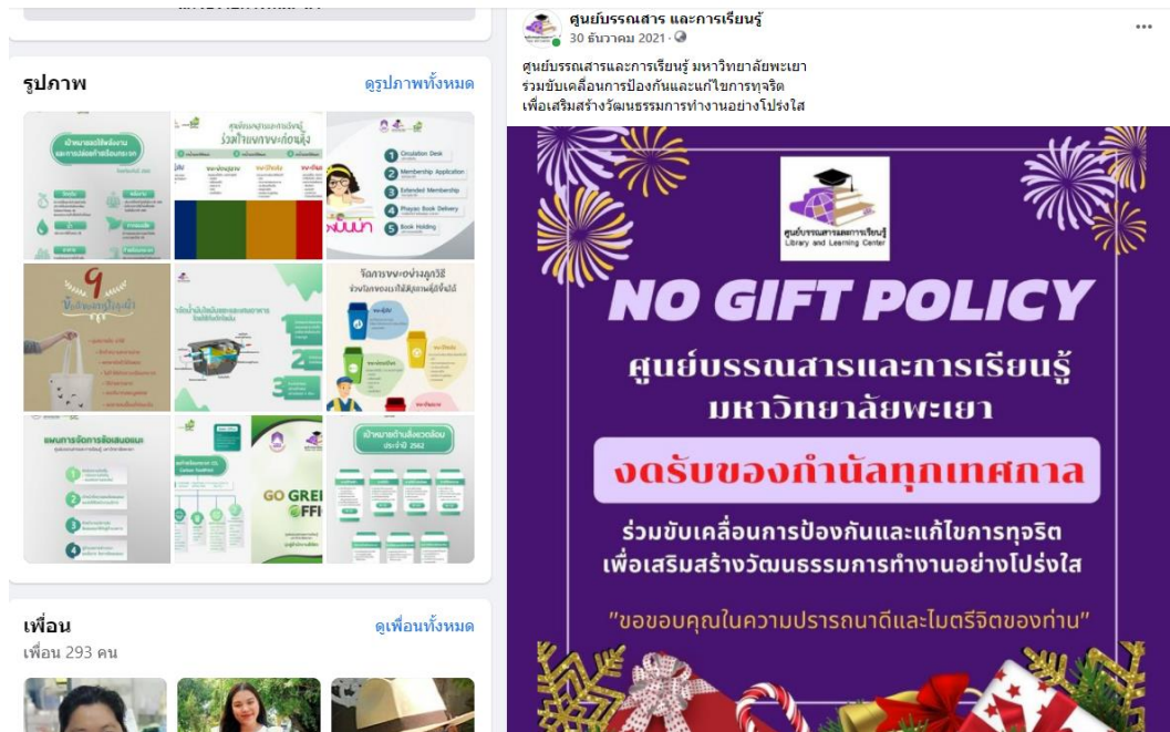
ภาพที่ 6 การรณรงค์ไม่ให้เกิดการก่อเกิดขยะเพิ่มขึ้นจากสิ่งของกำนัลในทุกเทศกาล ผ่าน Facebook และ Fan page ศูนย์บรรณสารและการเรียนรู้

11.2.5 ศูนย์บรรณสารและการเรียนรู้ร่วมรณรงค์ขับเคลื่อนการป้องกันและแก้ไขการทุจริต และเป็นการรณรงค์ไม่ให้เกิดการก่อเกิดขยะเพิ่มขึ้นจากสิ่งของกำนัลในทุกเทศกาล ผ่าน Facebook และ Fan page ศูนย์บรรณสารและการเรียนรู้