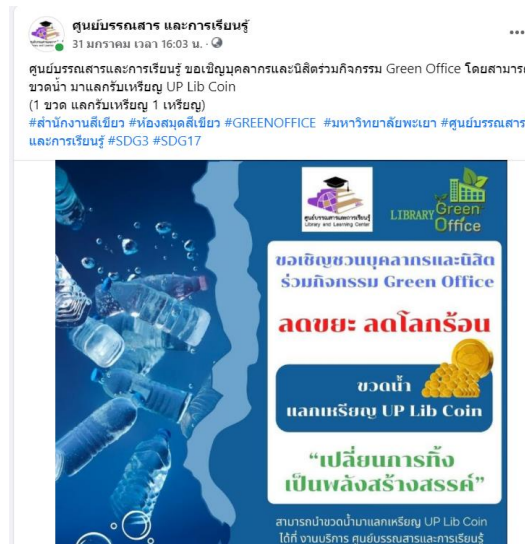
ภาพที่ 2 การประชาสัมพันธ์กิจกรรมขวดน้ำแลกเหรียญ UP Lib Coin ผ่าน Facebook และ Fan page

11.2.1 รณรงค์ลดขยะ ลดโลกร้อน “กิจกรรมขวดน้ำแลกเหรียญ UP Lib Coin” ผ่าน Facebook และ Fan page ศูนย์บรรณสารและการเรียนรู้