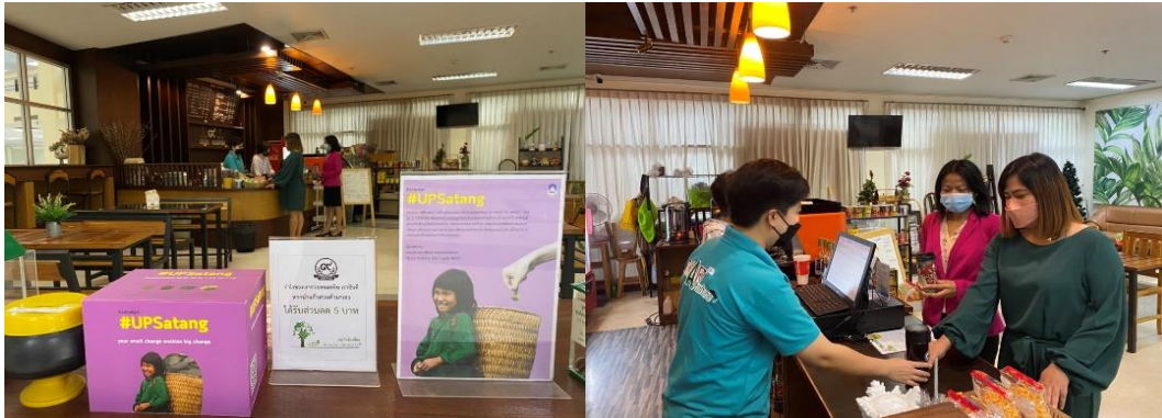
ภาพที่ 1 การรณรงค์การใช้แก้วน้ำส่วนตัว เพื่อสร้างจิตสำนึกให้กับบุคลากรศูนย์บรรณสารและการเรียนรู้

11.1.1 รณรงค์การใช้แก้วน้ำส่วนตัว เพื่อสร้างจิตสำนึกให้กับบุคลากรศูนย์บรรณสารและการเรียนรู้