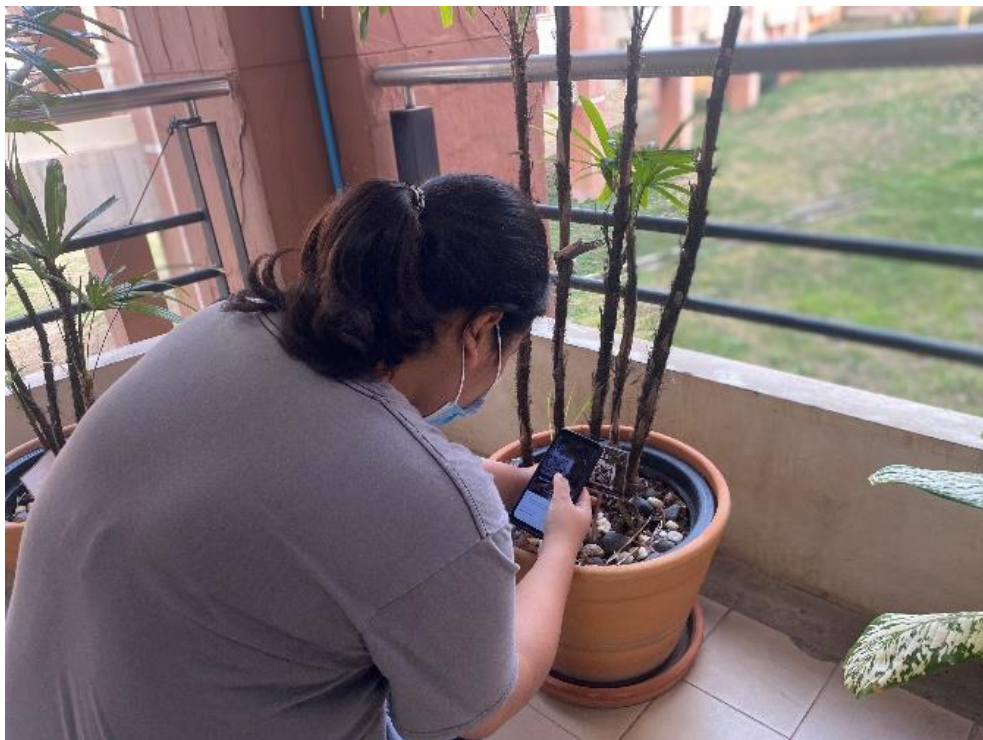
ภาพที่ 4 การบริการข้อมูลด้านสิ่งแวดล้อมให้แก่ผู้ใช้บริการ ผ่าน QR Code

11.2.3 บริการข้อมูลด้านสิ่งแวดล้อมให้แก่ผู้ใช้บริการ ผ่าน QR Code