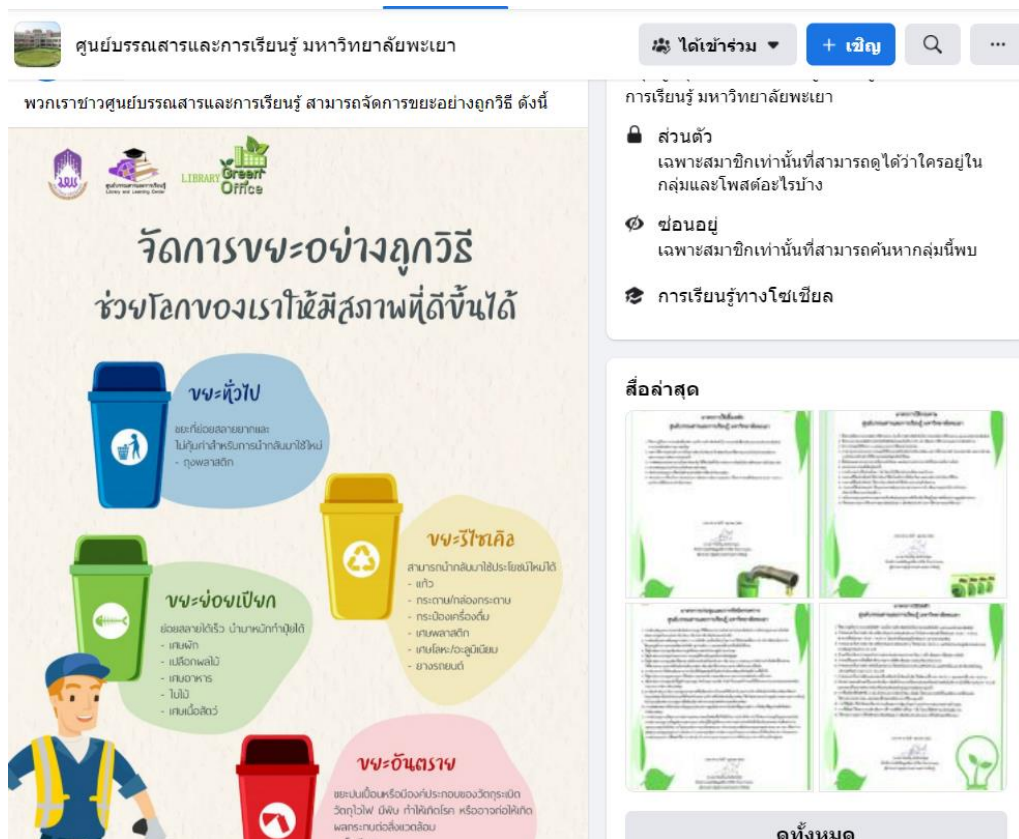
ภาพที่ 2 การประชาสัมพันธ์ผ่าน Facebook กลุ่มศูนย์บรรณสารและการเรียนรู้