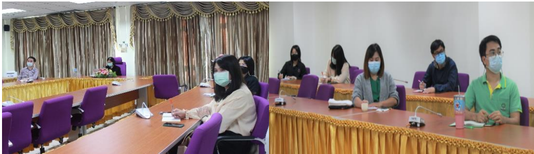
ภาพที่ 1 การประชุมชี้แจงเป้าหมายและมาตรการจัดการของเสีย