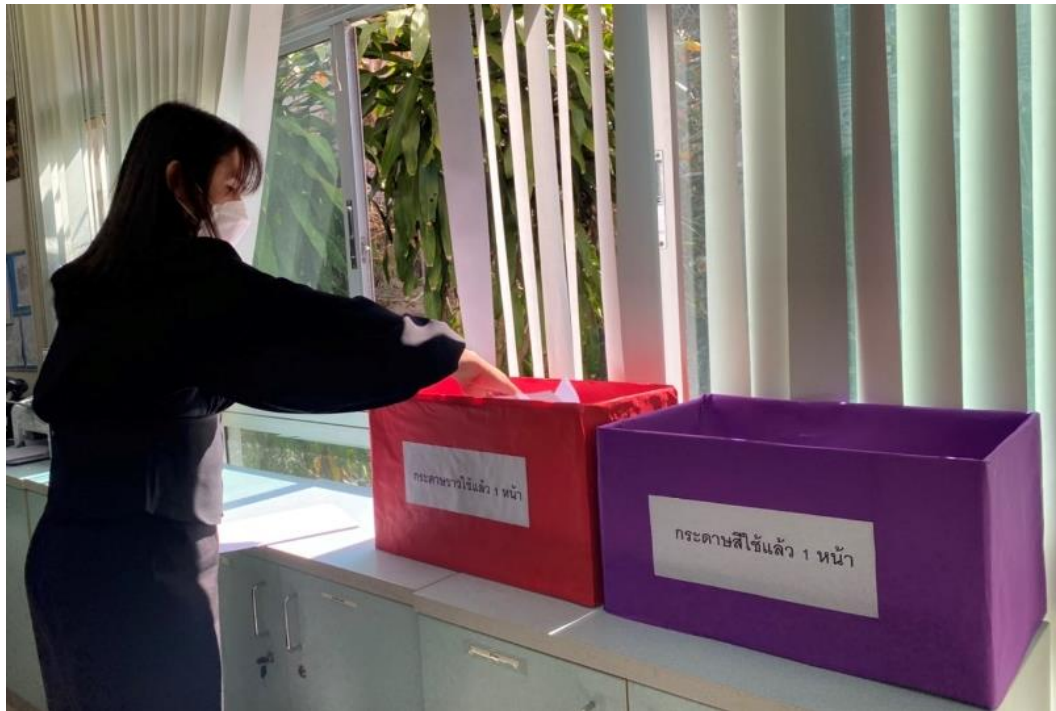
ภาพที่ 3 การสร้างจิตสำนึกในการใช้กระดาษให้กับบุคลากรศูนย์บรรณสารและการเรียนรู้