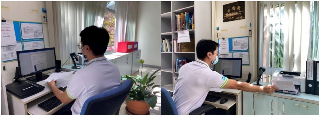
ภาพที่ 4 การสร้างจิตสำนึกในการใช้กระดาษให้กับบุคลากรศูนย์บรรณสารและการเรียนรู้