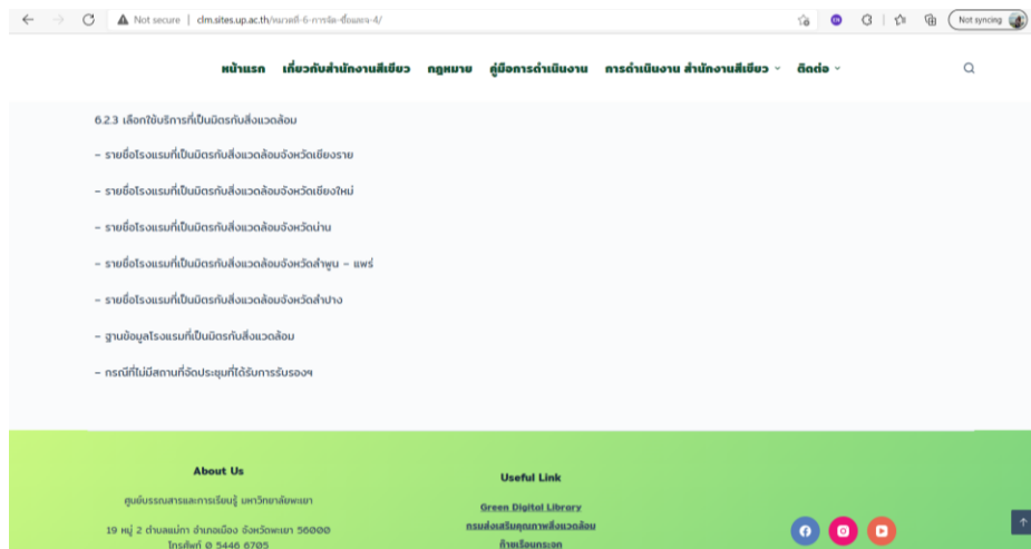
ภาพที่ 1 การสื่อสารข้อมูลผ่านเว็บไซต์สำนักงานสีเขียว ศูนย์บรรณสารและการเรียนรู้

8.1.1 การสื่อสารข้อมูล เรื่อง รายชื่อโรงแรมที่ผ่านการรับรองโรงแรมที่เป็นมิตรกับสิ่งแวดล้อมผ่านเว็บไซต์สำนักงานสีเขียว ศูนย์บรรณสารและการเรียนรู้